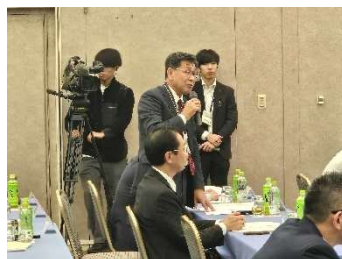
意見交換 (南浜頓別町長)