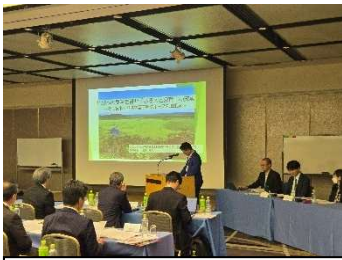
事例報告 (鶴間釧路市長)