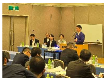
会長挨拶 (鶴間釧路市長)