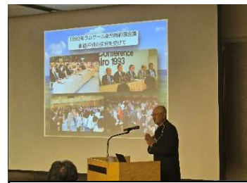
事例報告 (KIWC 新庄技術委員長)