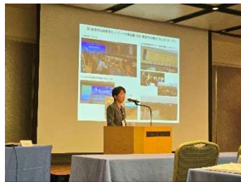
その他 (新潟市より)