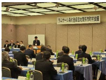
来賓挨拶 (環境省川越様)