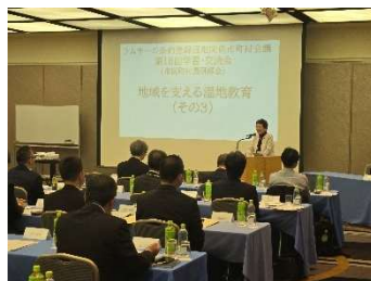
閉会挨拶 (大川栃木市長)