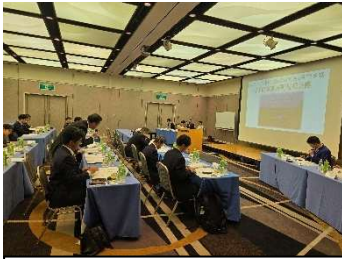
監査報告 (大崎市大場部長)