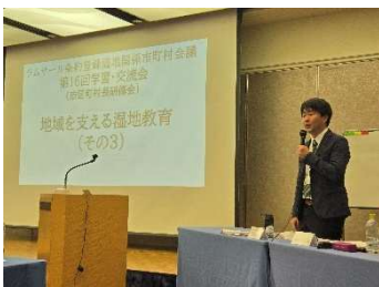
まとめ (田開准教授)