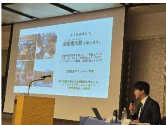
趣旨説明 (田開准教授)