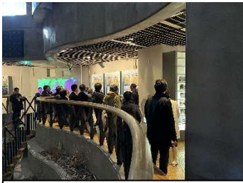
現地視察 (釧路市湿原展望台)