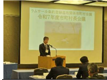
次期会長挨拶 (佐賀市池田副市長)