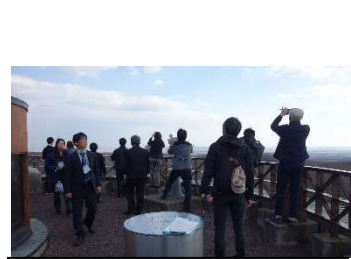
現地視察 (釧路市湿原展望台)