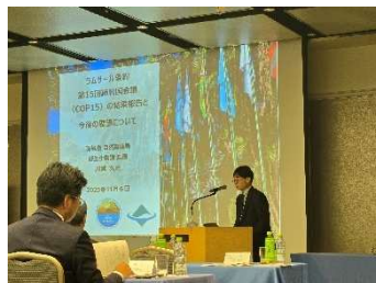
環境省より情報提供 (環境省川越様)