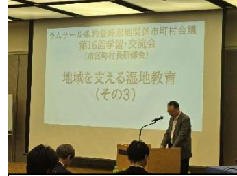
学習交流会来賓挨拶 (日本湿地学会矢部会長)