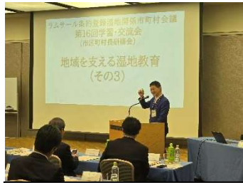
学習交流会開会挨拶 (鶴間釧路市長)