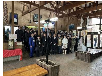
現地視察 (釧路市丹頂鶴自然公園)