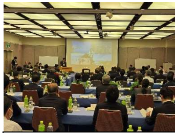
新規会員挨拶 (郡山市齊藤副市長)