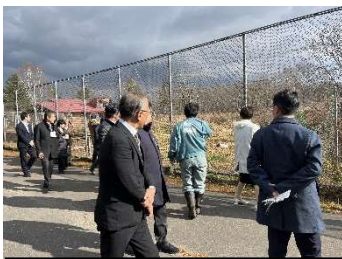
現地視察 (釧路市丹頂鶴自然公園)