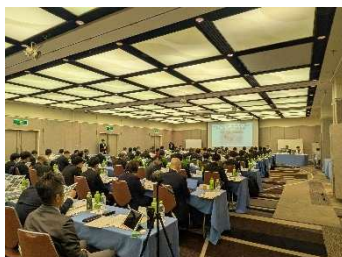
市町村長会議会場