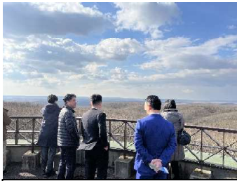
現地視察 (釧路市湿原展望台)