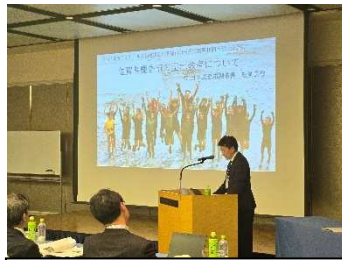
事例報告 (鹿島市鳥飼副市長)