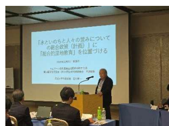
基調提案 (笹川名誉教授)