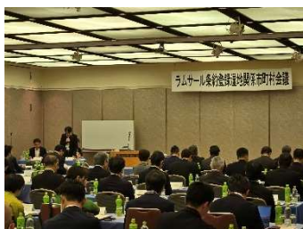
市町村長会議開会