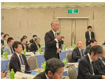
意見交換 (椎木出水市長)