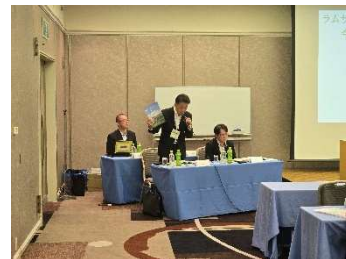
その他 (釧路市より)