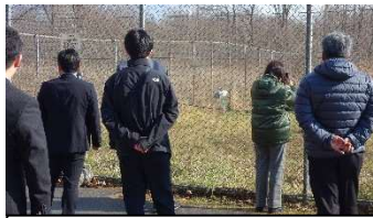
現地視察 (釧路市丹頂鶴自然公園)